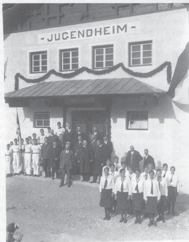
Eröffnung des Jugendheims 1932

„Unserem alten Pfarrer, der in dieser schweren Zeit sicher keinen leichten Stand hatte, hielten wir fest die Treue, wo doch bereits viele Leute im Dorf ihre religiöse Gesinnung verleugnet hat-