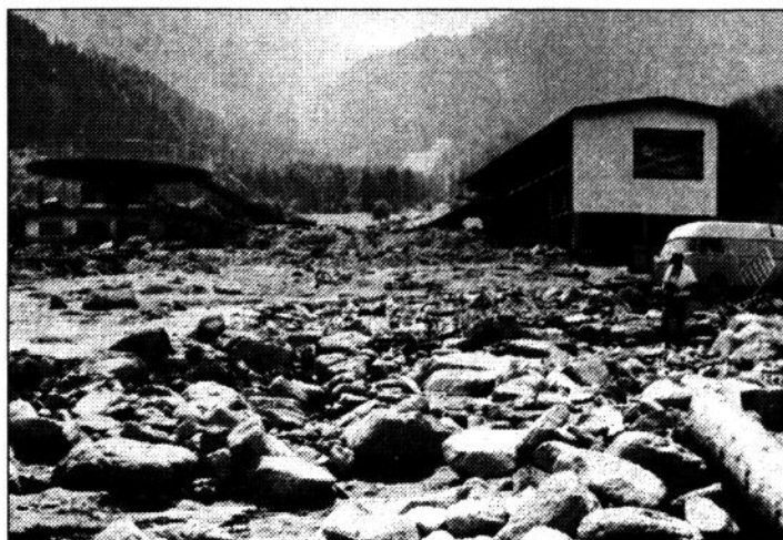
Das verwüstete Schwimmbad

prasselten schwere Hagelschlossen und wolkenbruchartige Regengüsse nieder. Die Hagelkörner wirkten in dem schon in den Vortagen von Gewittern aufgeweichten Boden wie Kugellager und brachten damit die