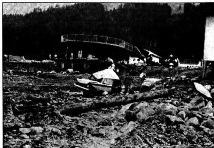
Zertrümmerte Autos, entwurzelte Bäume ...