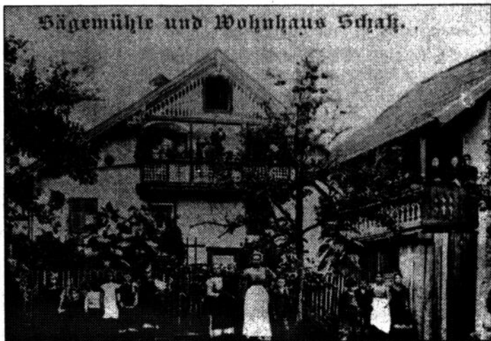
Sägemühle und Wohnhaus der Familie Schatz um 1900