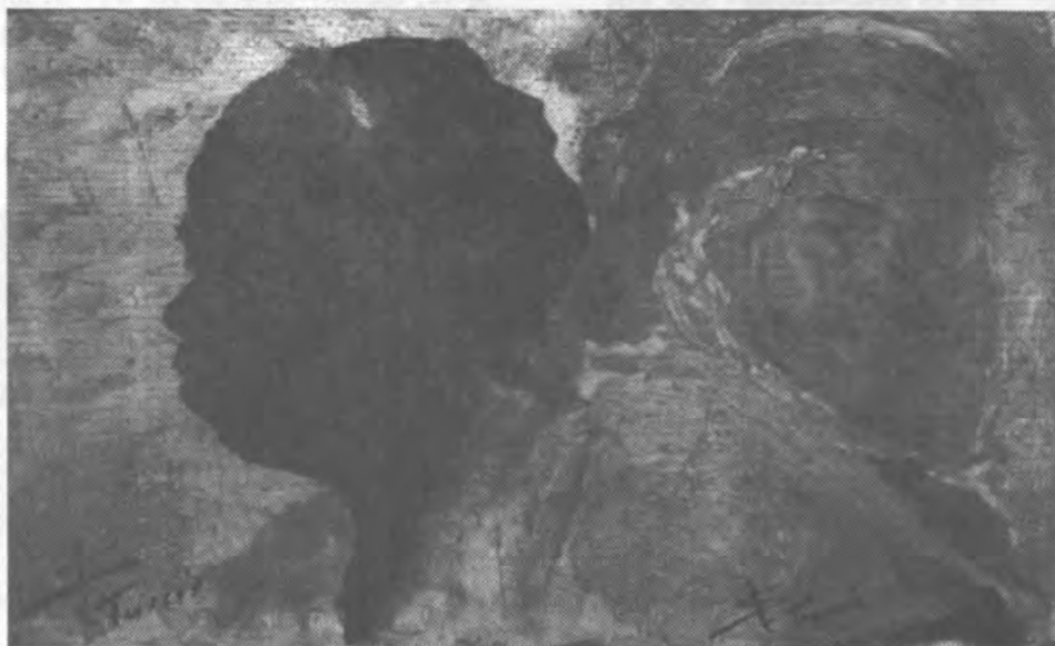
STRASSENTYPEN AUS TUNIS, 1884. Öl auf Holz, 14,2 x 23,5 cm, bez. li.u.re.u.; Innsbruck, Privatbesitz