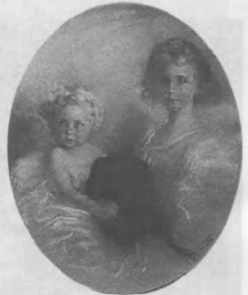
MÄDCHENDOPPELBILDNIS MIT HUND (Kinder des Herzogs von Alencon), um 1906. Pastell auf Pappe, 90 x 75 cm (oval gerahmt), bez. re.u.; Inzing, Privatbesitz (Dr. Josef Schörmer)

Der nun vom Ausland anerkannte Künstler zog 1891 nach Innsbruck, wo er sich dann, abgesehen von einigen Arbeitsaufenthalten in verschiedenen europäischen Städten, seinen festen Wohnsitz einrichtete.