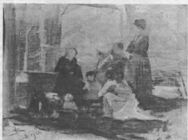
oben: Frauengruppe aus Chioggia, um 1883, 19,2 x 14,8 cm, bez.l.u., Innsbruck, Privatbesitz