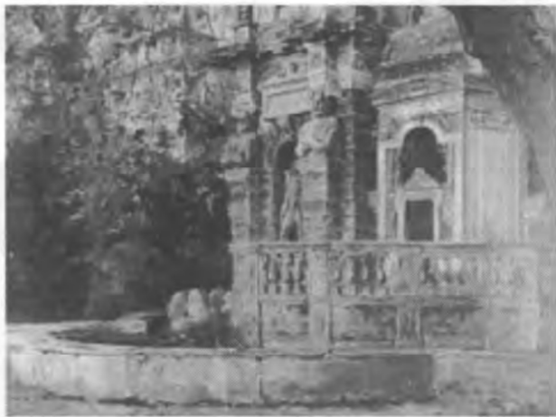
Fontana dell' Organo Idraulico (Wasserorgel), Terrassengarten Tivoli in Rom, Öl auf Holz, 31,5 x 40,5cm, Innsbruck, Privatbesitz