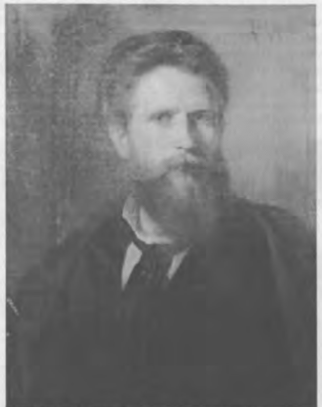
Erstes Selbstbildnis, 1883, Öl auf Leinwand, 58 x 44,8cm, sign. und bez. r.o., Gemeinde Inzing

Bietet Ihnen das Ihre derzeitige Versicherung auch?