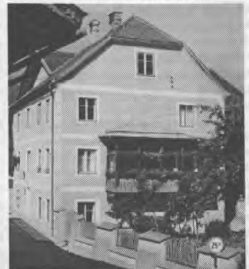
In diesem Haus in der Kirchgasse war die Werkstatt untergebracht.