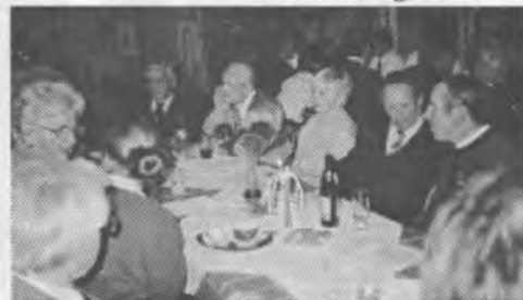
Bilder von der Weihnachtsfeier 1997