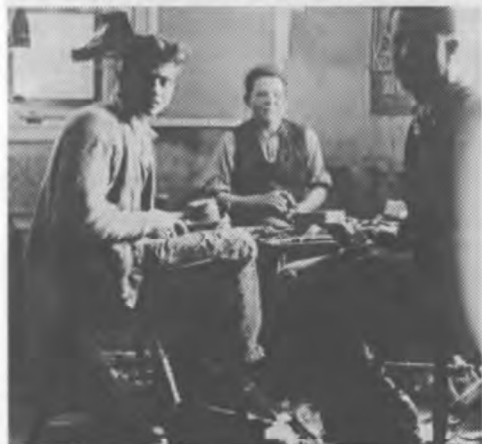
Bis zu drei Mitarbeiter waren in diesem kleinen Betrieb beschäftigt.

So konnte er auch immer wieder Spezialaufträge bearbeiten, wie zum Beispiel von 1959 bis 1961 Unfallverhütungsschuhe mit Stahlkappen für die Haller Röhrenwerke. Ab