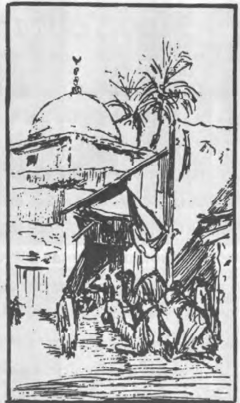
Marktplatz in Tunis