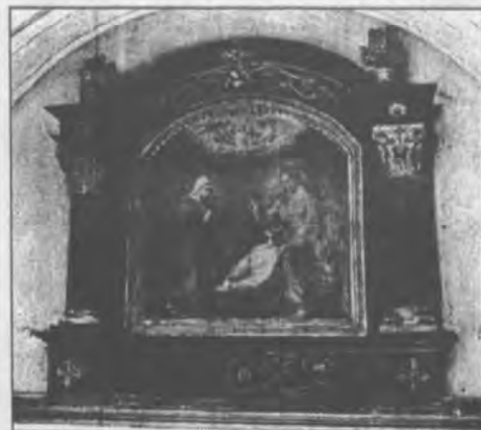
"Der Tod des heiligen Josef" für die Josefenkapelle in Kematen

Kurze Zeit arbeitete der nun Siebzehnjährige als Gehilfe beim Historienmaler Franz Plattner aus Zirl. Er stand für ihn Modell und half ihm beim Ausmalen der Zirlrer Kirche.