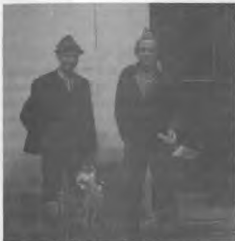
DER "MUNDL" MIT DEM "SAMOAN" BEIM ALTEN GEMEINDEHAUS UM 1981

hellte sich sein Gemüt auf und machte damit dem alten Spruch: „Ein edles Herz in rauher Schale“, alle Ehre.