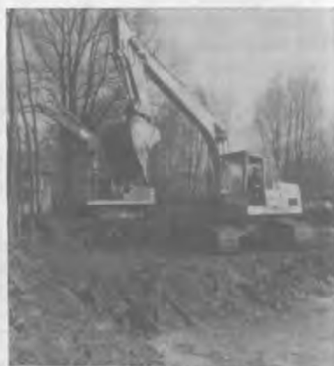
SANIERUNG DER GAISAU 1987

In ihrer Broschüre „Monticula“ über das Vogelparadies Gaisau haben vor rund 10 Jah-