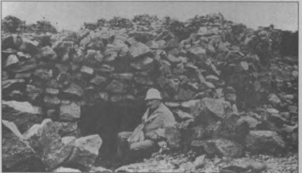
Der Toni vor einer der alten Stellungen