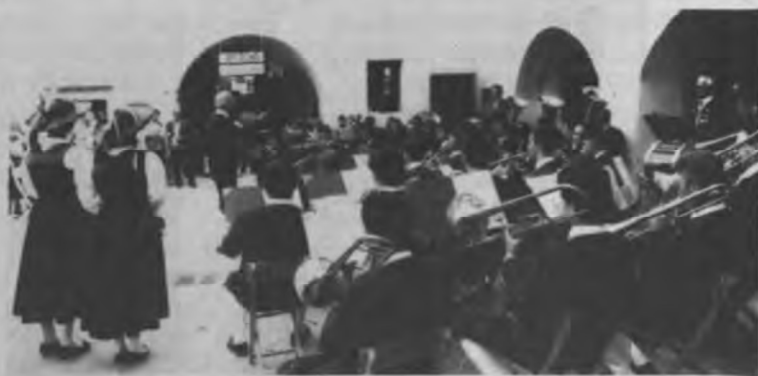
Konzert der Inzinger Ehrenkapelle in Caldonazzo, 26. Mai 1990