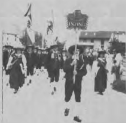
Die Inzinger Ehrenkompanie in Caldonazzo

kompanien aus Nord- und Osttirol, die Musikkapelle aus Folgaria, Schützenkompanien aus Südtirol, die Musikkapelle Albiano aus dem Trentino und die Welschtiroler Schützenkompanien teil. Es war ein farbenfroher Zug, der sich durch das Dorf bewegte und von den anwesenden Zuschauern mit Applaus bedacht wurde.