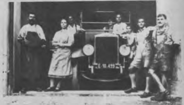
Viel Freude und Stolz mit dem ersten Lastauto

Wir können uns heute sicherlich keinerlei Vorstellungen davon machen, aus welchen verschiedenen Beweggründen