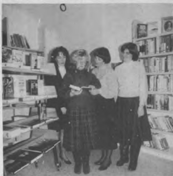
... die "guten Geister" der Inzinger Bücherei

Den Veranstaltern und Mitwirkenden an dieser schönen Feier, sowie der Kirche und der Gemeinde für die Erweiterung der Bibliothek gebührt Dank und Aner-