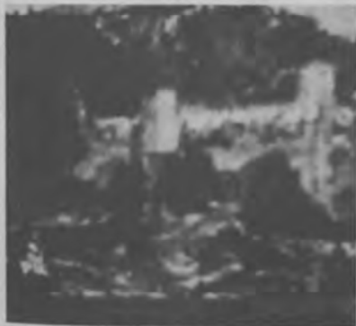
Die Burg der Ritter von Eben

Das älteste Wappen der Ebener Ritter stammt aus der Zeit um 1280 und zeigt ein nach oben gerichtetes Dreizackeisen. Der Wappenschild ist