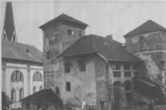
Das Schloß - um 1980