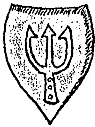
Alberis de Eben 1280

schwarz und golden gefärbt. Im Laufe der Zeit war es aber ständigen Änderungen unterworfen, wie die folgenden Bilder beweisen.