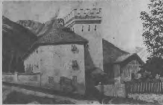
Das Schloß - um 1910